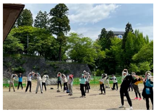
出発前のストレッチ体操