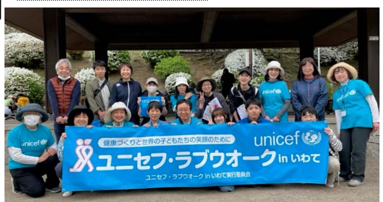
ボランティアスタッフ