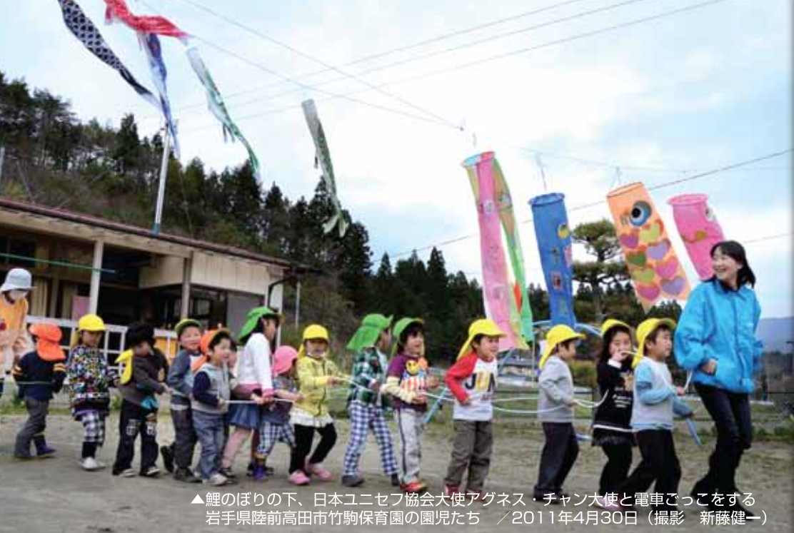
▲鯉のぼりの下、日本ユニセフ協会大使アグネス・チャン大使と電車ごっこをする 岩手県陸前高田市竹駒保育園の園児たち / 2011年4月30日