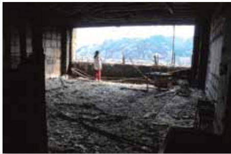
▲大槌小学校2階の教室 / 2011年3月31日

沢山の輝く命、溢れるやさしさ、 限りない希望が生まれています。 失われた尊い命、魂に支えられて、 次の世代は逞しく育っていくでしょう。 沢山の写真家の方達の心の目に映った 大震災の瞬間、私もじっと目を凝らして 見つめてみたいと思います。