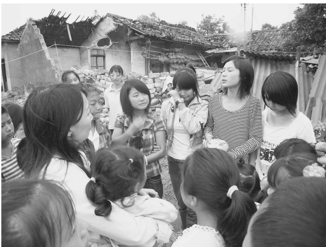
2008年5月中国四川省大地震 6月末被災地を訪問したアグネス・チャン大使